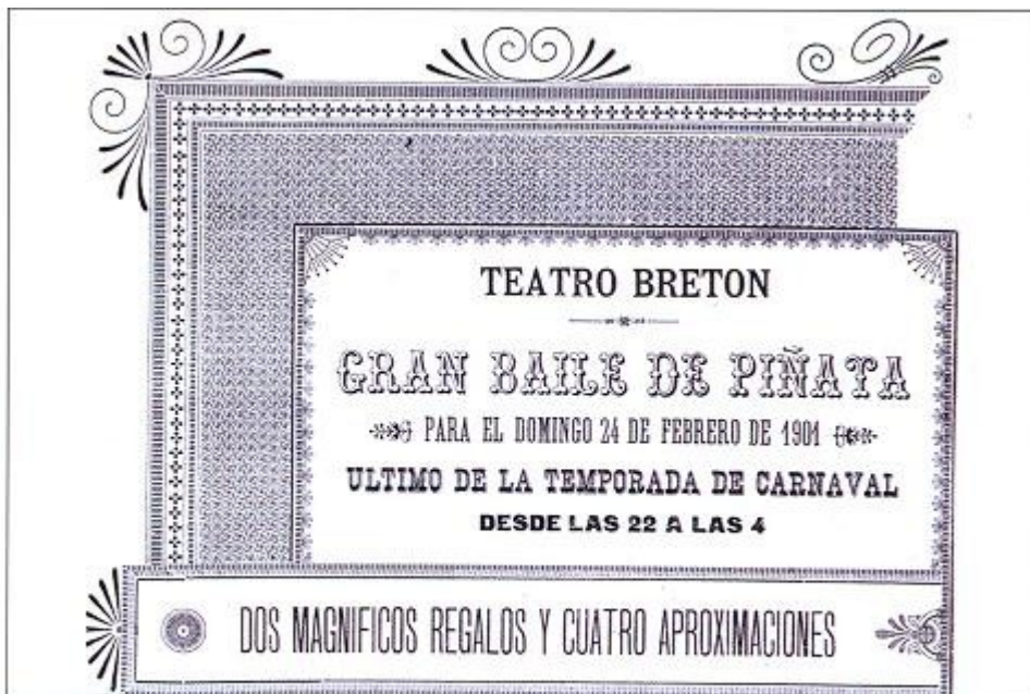
Las madres que acompañaban a sus hijas al Gran Baile de Piñata entraba gratis (Archivo R. Hipola).

Poco duró el tratado, pues en marzo del año siguiente se produjo en nuestro país un alzamiento nacional y la caída de Godoy, por extrañamiento que parezca llamado Príncipe de la Paz. La Guerra de la Independencia iba a alterar profundamente la vida de Salamanca y a ocasionar grandes pérdidas para la ciudad.