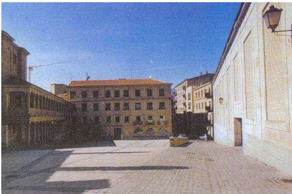
Es fácil imaginar lo animada y concurrida que estaría la vieja plaza de san Román los días de función.

Calle el Grillo arriba me digo -todavía con la imagen en la retina de los carteles que hasta hace pocos días anunciaban algunas de las últimas películas exhibidas en su pantalla: «Hable con ella» de Pedro Almodóvar y «El gran dictador» de Charles Chaplin, en versión original- que el Bretón no puede desaparecer, pues hay pocos lugares en la ciudad tan cargados de historia como el que ocupa el teatro y sus alrededores.